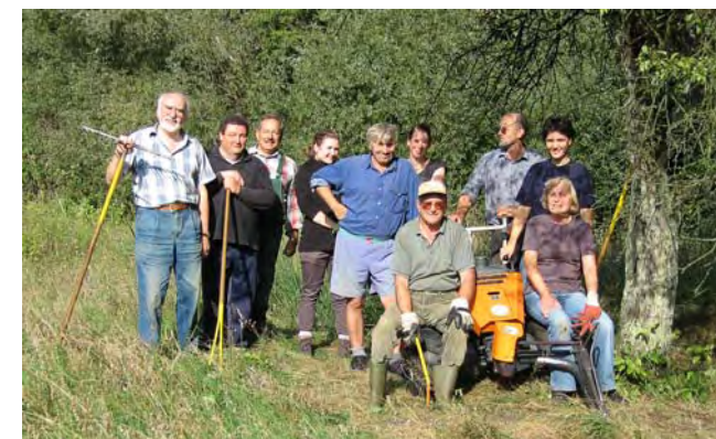
Die Biotopschutzgruppe auf einer Orchideenwiese, der „Schweineweide“