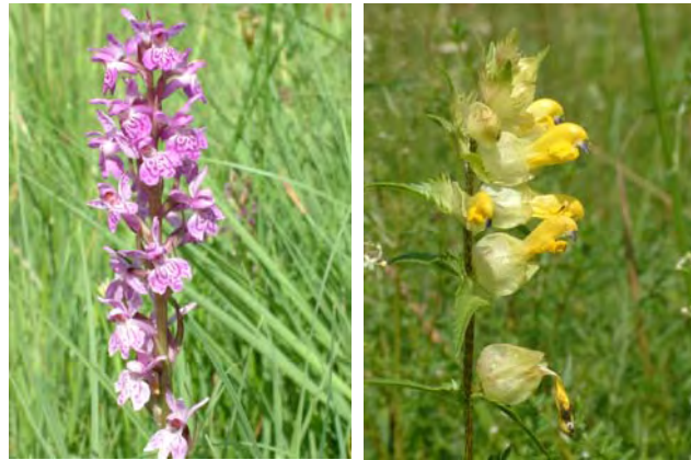
Links: Breitblättriges Knabenkraut Rechts: Klappertopf

Zum Beispiel die „Mömawiese“ im Norden der Stadt. Hier kommen wunderschöne Pflanzenarten vor. Der Erfolg unserer kontinuierlichen Biotopschutzarbeit ist aus der Grafik unten deutlich abzulesen. Langer Atem ist jedoch bei der Biotoppflege notwendig.