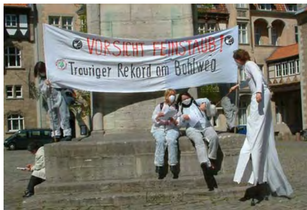
Feinstaubdemo auf dem Burgplatz