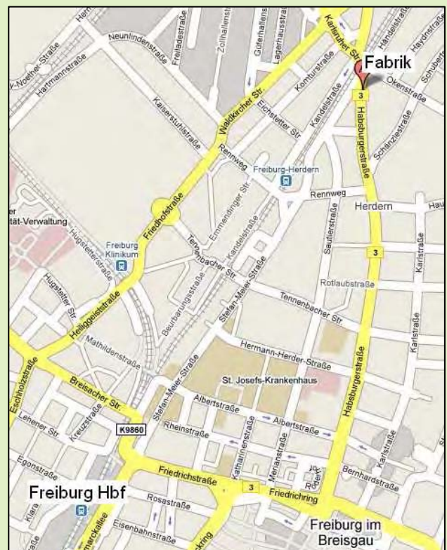
Die FABRIK liegt im Stadtteil Herdern, ca. 25 Gehminuten von der Stadtmitte entfernt. Von der Stadtmitte (Bertoldsbrunnen) fährt die Straßenbahnlinie 2 Richtung Zähringen. Haltestelle "Okenstraße"