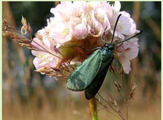
Bild: Gemeines Grünwidderchen an einer Grasnelke

Sie können auch gerne später dazustoßen. Detailinformationen und Anmeldung zur Bildung von Fahrgemeinschaften unter 0531 – 15599 oder 0160 - 920 636 96 oder in-fo@bund-bs.de